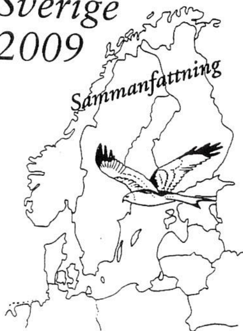
En skiss till en nationell vision Samrådsmaterial - februari 1994

gäller markanvändningen och lokaliseringmönster. Visionen om Sverige 2009 ger en splittrad bild, kanske beroende på förutfattade meningar om vad som är en politiskt möjlig förändring i stället för att mer förutsättningslöst se vilka krav en hållbar utveckling kräver.