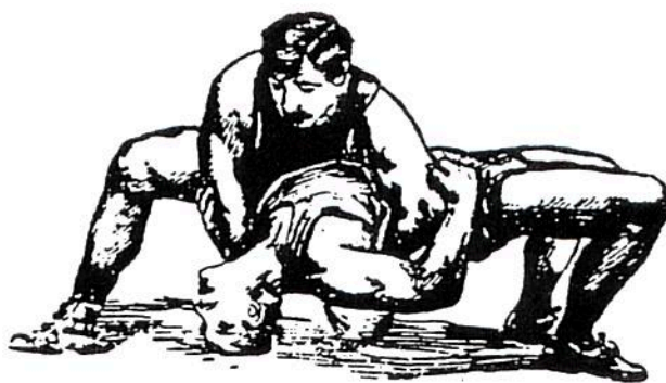
FoB:en i svår brygga - kan den undgå fall?

Vad kan vi då vänta inför framtiden? Som jag inledningsvis antydde så uttryckte kommissionens ordförande klart vid det andra mötet att kommissionen inte längre tvekar över att kommunerna för sin planering behöver kontinuerlig information om hus-håll lägenheter och pendling