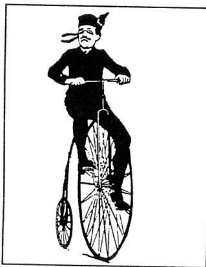
Är organisationsöversynen ute och cyklar (utan cykelbyxor - tights)?

De omfattande allmänna besparingskraven kan givetvis ställa frågan på sin spets om dessa arbetsuppgifter över huvudtaget ska utföras. Då gäller det att få de beslutande att "se längre än vad hans nos är", att inse vikten av långsik-