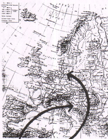
Inte hit, men kanske dit?