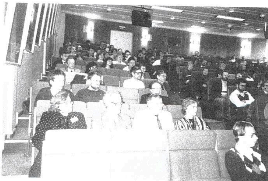
Delar av KSP:s styrelse bland intresserade åhörare vid flyttkonferensen

Under våren 1988 kontaktades alla föredragshållare - i regel forskare. Vi hade ett möte med samtliga föredragshållare i september - en halvdags "löpsedelskonferens" - för att föredragshållarna skulle