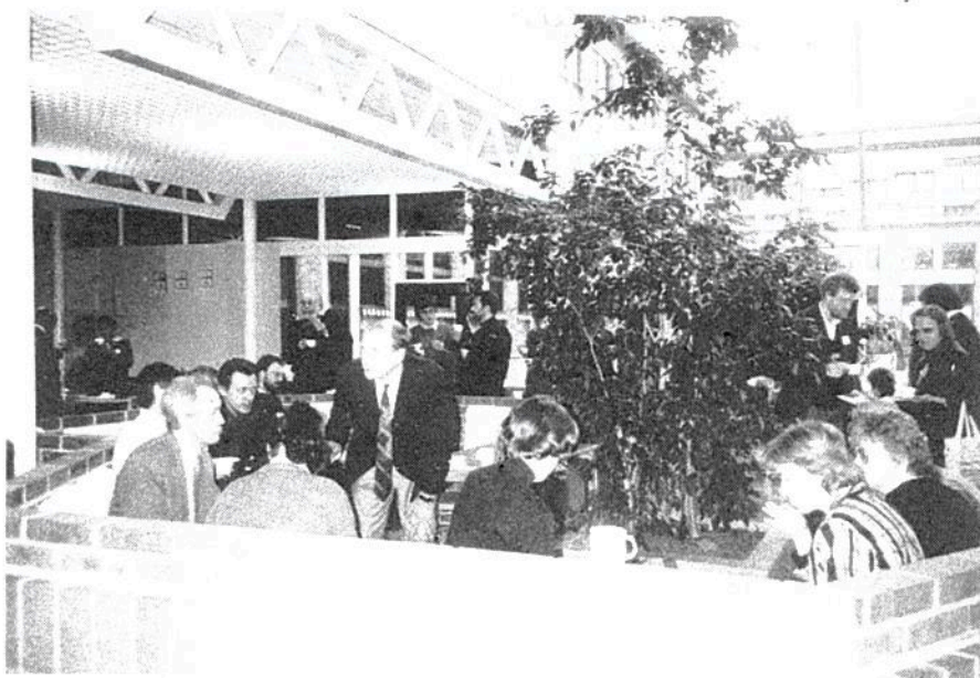
Erfarenhetsutbyte i Vårdskolans entréhall