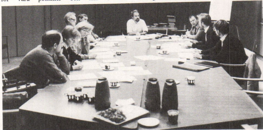
Styrelsen i arbete

kommunikation. Informationssamhället ställer speciella krav på oss tror jag. Det kommer att bli så att information/data kommer att vara tillgänglig för nästan alla som har tillgång till en PC om några år. Vi har inte längre något "informationsmonopol" om nu någon trodde det. Men blotta mängden av information kommer att ställa till trassel för våra politiker och alla i den