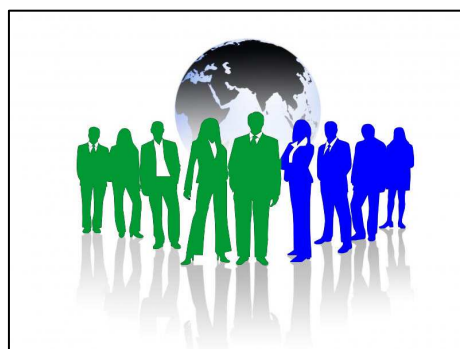
Samverkans- och affärsmodell

Gemensam infrastruktur för geodataförsörjning för att förverkliga Inspire och den nationella geodatastrategin