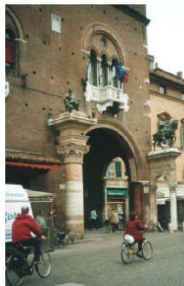
Entrén till stadshuset i Ferrara.

Man planerar också ett stort möte om Agenda 21 likt det i Porto Allegre (motmöte till New York) för att få befolkningen engagerad.