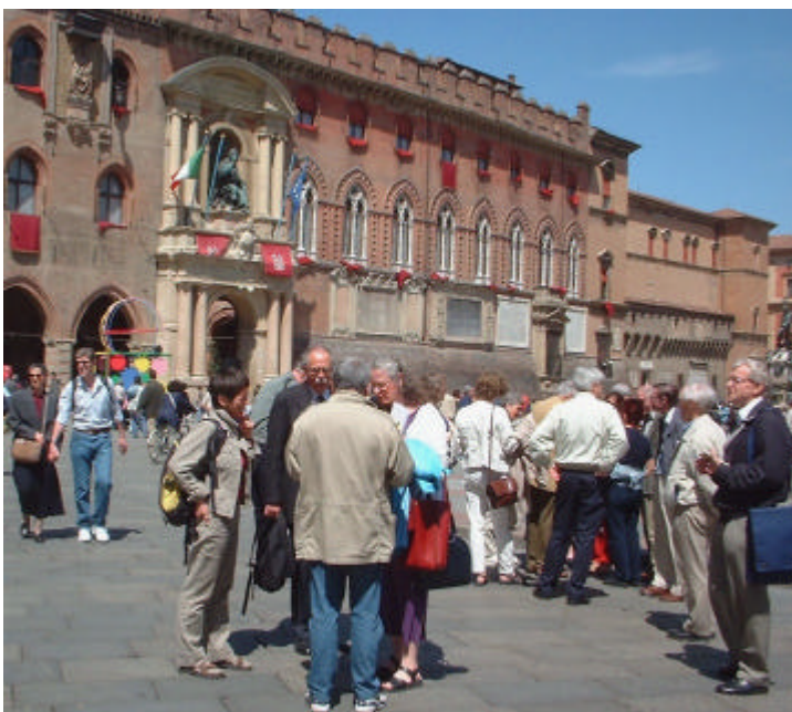
Två välbesökta turistmål i Bologna. Piazza Maggiore till vänster och Due Torri till höger. Det ena tornet lutar faktiskt ganska mycket.