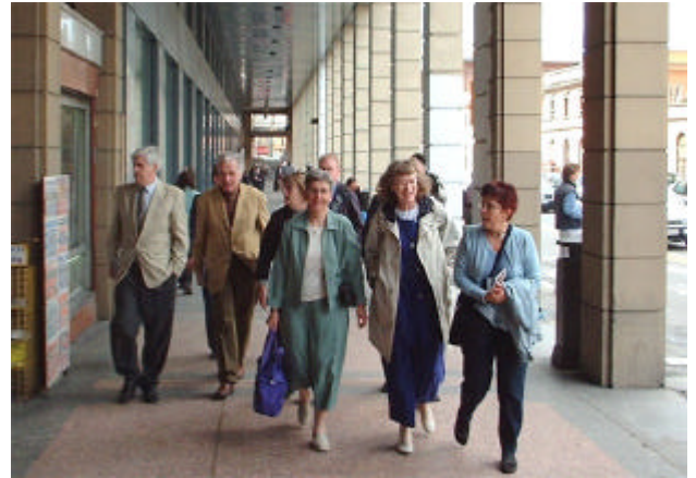
Bolognas kilometerlånga arkader skänker svalka soliga dagar och regnskydd andra dagar. Arkaderna skapar onekligen en behagligt kombinerad känsla av trygghet, flärd och klassicism.