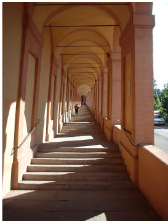
... vandrade den två kilometer långa arkaden upp till kyrkan Madonna di San Luca utanför staden.